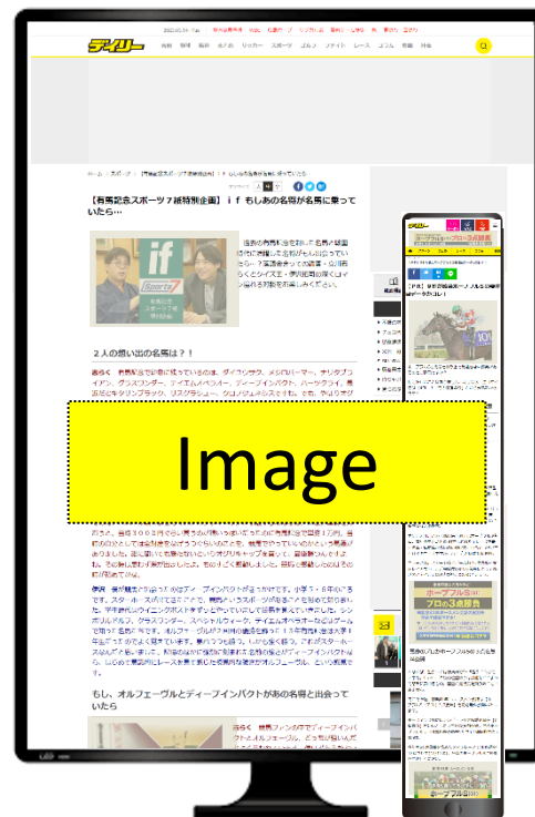
□タイアップ広告ページ